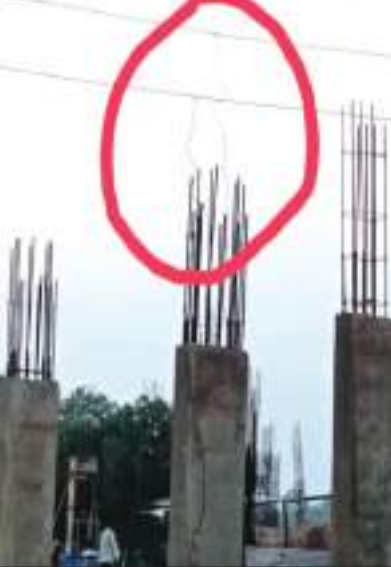
बिजली विभाग के तारों पर तार टाँग कर चोरी करता ठेकेदार

मिलने पर जब मौके पर पहुँचे तो ठेकेदार के कर्मचारी ने कैमरा देखकर तार उतारना शुरू कर दिए। वीडियो सामने आने के बाद बताया जा रहा है इसके बाद बिजली विभाग ने मौके पर मीटर टाँग दिया। लेकिन पिछली बिजली चोरी के लिए क्या कार्यवाही की इसकी कोई जानकारी नहीं दी।