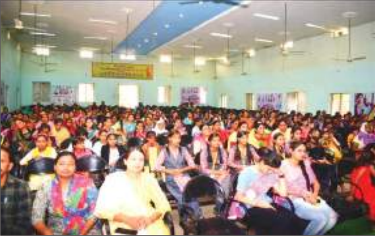
माही की गूंज, बड़वानी।