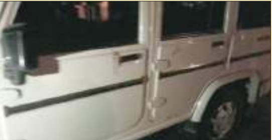
ठेकेदार के उक्त बोलेरो जीप से रोकी कर अवैध शराब सलाई करने वाले वाहन को नहीं किया जप्त।

राणापुर थाने की कंजावानी पुलिस चौकी क्षेत्र में ग्रामीणों ने मंगलवार रात में एक पिकअप एक बोलेरो जीप को तेज गति से आते हुए देख संश्रिक अवस्था में रोका गया। वाहन को रोकने के बाद एक बाँड़ी पिकअप में अवैध शराब की पेटियाँ मिली, जिसके बाद पुलिस को ग्रामीणों ने सूचना दी। सूचना पर पुलिस रात्रि में मौके पर पहुंची, तो ग्रामीणों ने पुलिस को बोलेरो जीप व पिकअप वाहन को शराब के साथ सुपुर्द किया, साथ ही ग्रामीणों के हथिये चढ़ाए शराब दुकान का