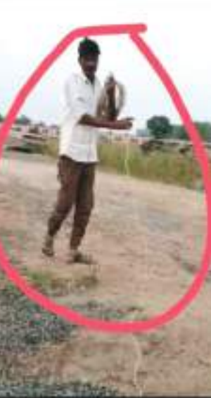
वीडियो बनाता देख बिजली के तार बटोरता ठेकेदार का कर्मचारी।